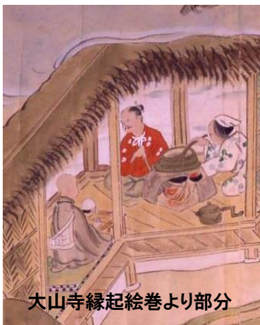
大山寺縁起絵巻より部分

また弘誓坊が地蔵坊から帰路にもらった一包みの白米は、長い道中も尽きることがなく、伯耆大山の僧や参詣者にも分け与えられたということです。