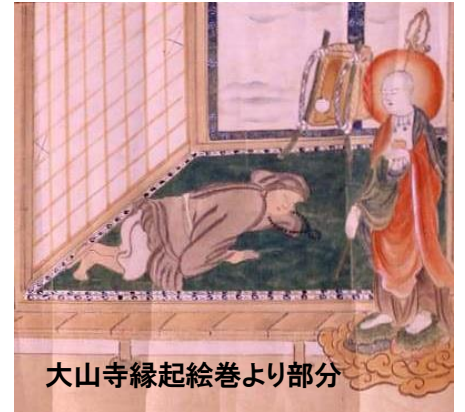
大山寺縁起絵巻より部分

大山ではナナカマドのことをナナカマノキと呼んでいます。「七竈」ではなく「七釜樹」と書きます。14世紀半ばごろに編集された大山寺縁起にその由来に関わる説話があります(大山寺縁起 22章)ので、下記に概要を紹介します。