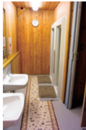
コインシャワー室

見ることができ 情報コーナー では、自然情報 を検索できるタ ッチパネル式端 末を使って、最 新のイベント情 報、いきもの図 鑑、上高地の歴 史、散策コースガイドなど豊富なコン テンツを自由に利用できる。中でも上 高地シアターに収められた映像は、さ まざまな視点でとらえた上高地や北ア ルプスの景観が堪能でき、特におすす めである。