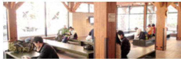
広々とした休憩スペース

さらに、正面入り口左手に設置されたフィールドガイドマップは、上高地散策の情報がひと目でわかるようになっている。その横には、現在上高地で見られる動植物の最新情報が写真で展示されている。 そのほか、登山道の情報が掲示されている登山情報マップ、上高地の特殊な地形がひと目でわかる地形模型なども興味深い。情報ディスプレイには天候のほか、山小屋に設置されたライブカメラの映像が映し出され、美しい北アルプスの景色を